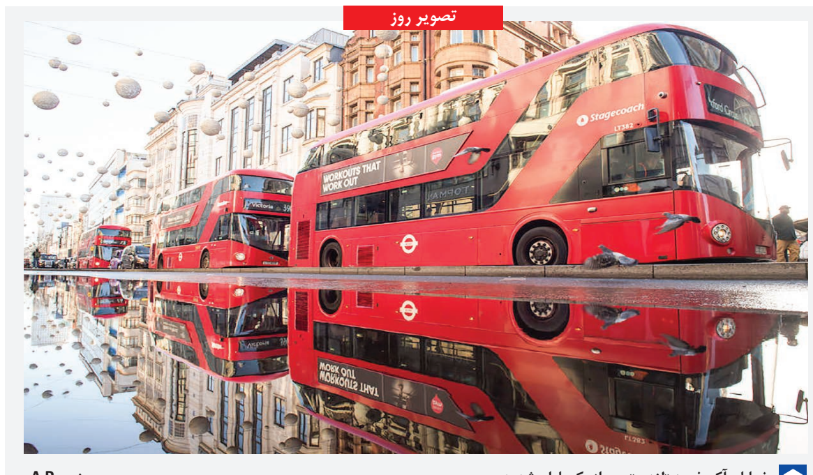
خیابان آکسفورد لندن پس از یک باران شدید