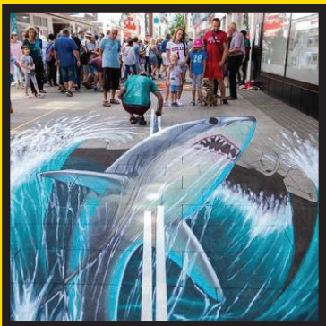
نقاشی سه بعدی در شهر «ویلهلم شاون» آلمان