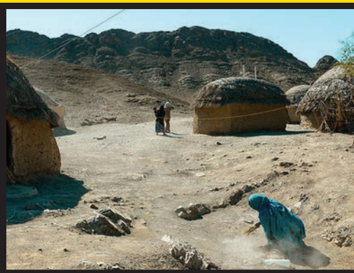
«تچک» روستایی بزرگ از توابع «بشاگرد»، سرزمینی که در رودهایش خاک جاری است