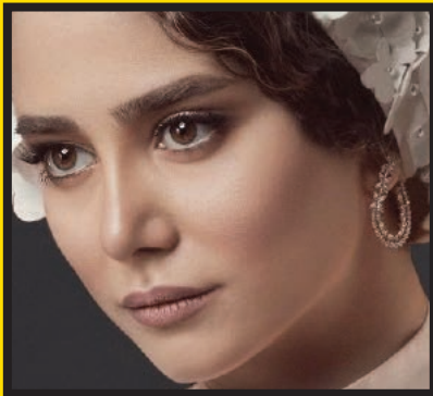
الناز حبیبی (بازیگر) مدل عروس می‌شود