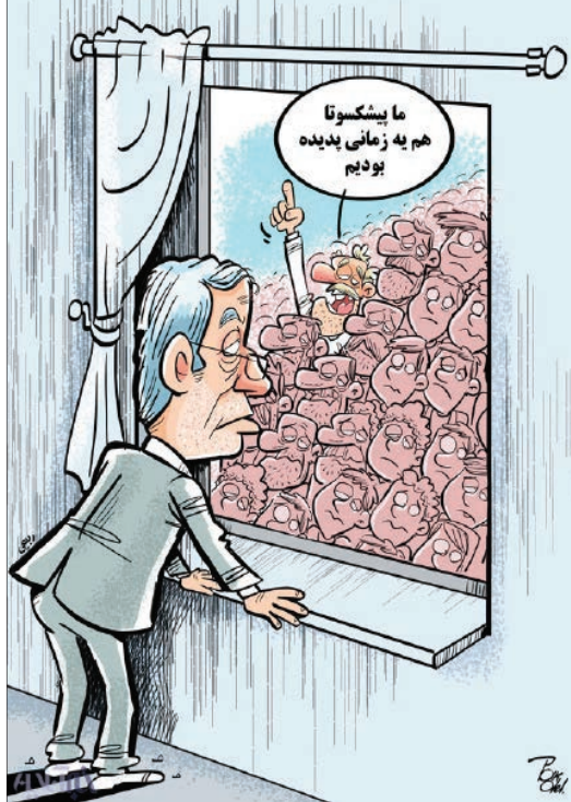
پدیده بیکاران شیک کشور (خبر آنلاین)

کار بد و گناهی مواجه می‌شوند، آن را با کار خوبی از بین می‌برند؛ چه این بدی از خودان‌ها سر زده باشد و چه از دیگران. در حدیثی از امام علی (ع) باری فراهم می‌کند که در این حال اشکال را باید در ویژگی‌های فردی و اجتماعی آنان جست و جو کرد.