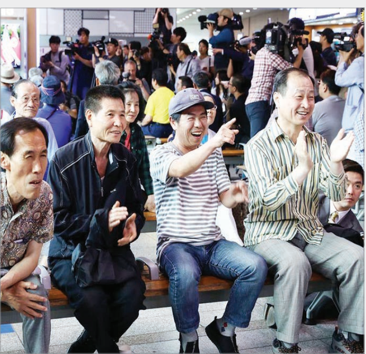
مردم کره شمالی در حال تماشای مذاکرات